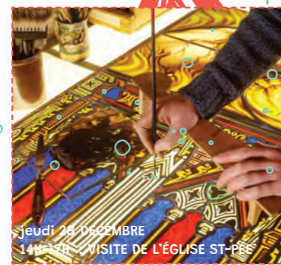
JEUDI 28 DÉCEMBRE 14H-17H VISITE DE L'ÉGLISE ST-PÉE