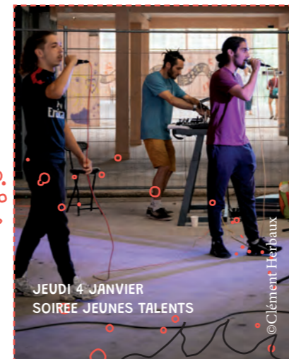
JEUDI 4 JANVIER SOIRÉE JEUNES TALENTS