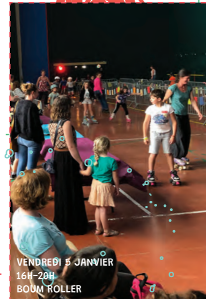
VENDREDI 5 JANVIER 16H-20H BOUM ROLLER