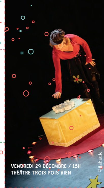
VENDREDI 29 DÉCEMBRE / 15H THÉÂTRE TROIS FOIS RIEN

- Arrivée sur le parvis de la médiathèque-