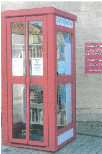
Ancienne cabine téléphonique à Argences (Calvados)

c) La boîte à livres est très petite et exposée aux intempéries. Certaines communes réutilisent d'anciennes cabines téléphoniques. Ce pourrait être une solution.